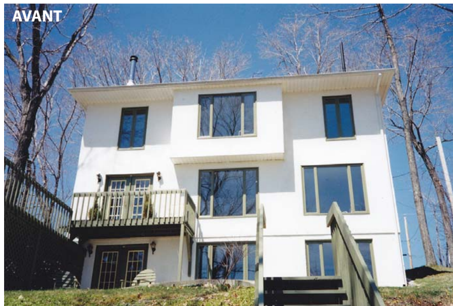
Un aperçu du côté sud de l'agrandissement avec son nouveau lien en quart-de-rond. La partie gauche superpose le magnifique solarium à la chambre d'invités. La galerie supérieure offre un agréable «poste de vigie» sur le fleuve Saint-Laurent.

sujet, la MRC de l'île d'Orléans nous informait des caractéristiques de cette zone Boisée. Les avantages écologiques (équilibre hydrostatique et micro-climatique stabilisation des pentes) et esthétiques, voir même culturelle (limite septentrionale de l'aire de distribution d'une chenaie boreale) militent en faveur de sa protection. C'est pourquoi l'architecte suggère de localiser l'agrandissement sur l'em-